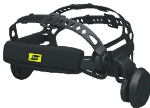
Imbracatura comfort in 5 punti Halo™ (vista frontale)

Per maggiori informazioni, visitare esab.com .