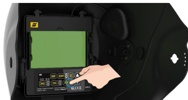
ADF di classe ottica elevata, con interfaccia touchscreen a colori